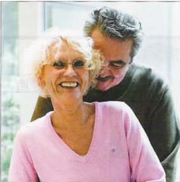
Zielgruppe 50-Plus: Die beiden glücklichen Menschen auf diesem Foto sind auch im wirklichen Leben ein Paar.