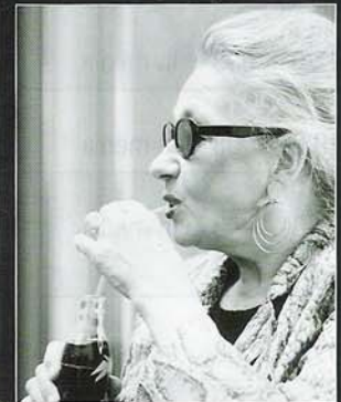
Urbane Städter in Aktion: Für die Partyszene wurde gleich ein Catering vom benachbarten Café „Les Halles“ geordert. Auch der Sekt im Glas perlte echt!