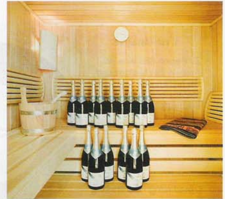
Zielgruppe urbane Städter – sie feiern gern!